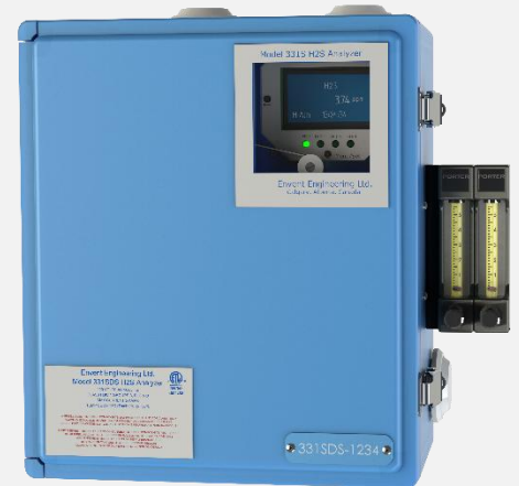
Analizador de H 2 S Envent Modelo 331SDS