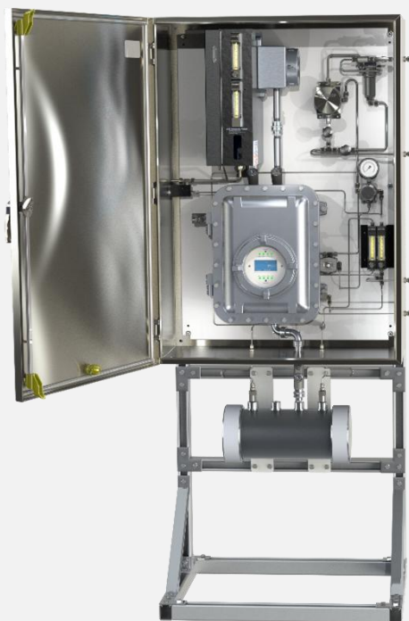
Analizador de H 2 S y azufre total 331SDS con Auto-Calibración en un gabinete de acero inoxidable