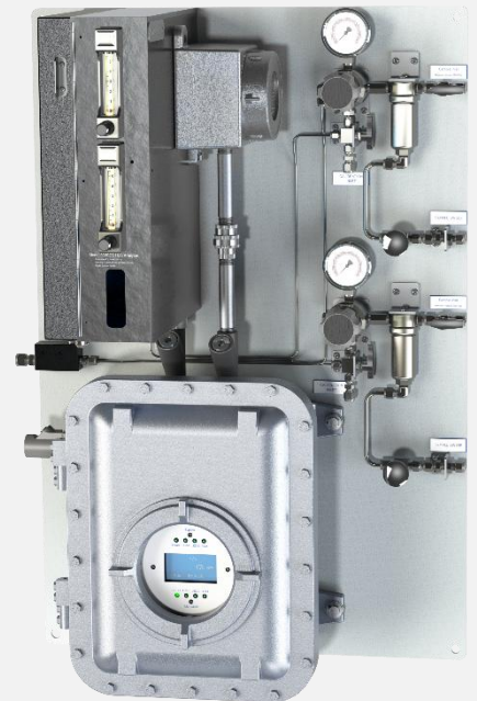
Envent Modelo 330SDS con Sistema de acondicionamiento de muestra standar