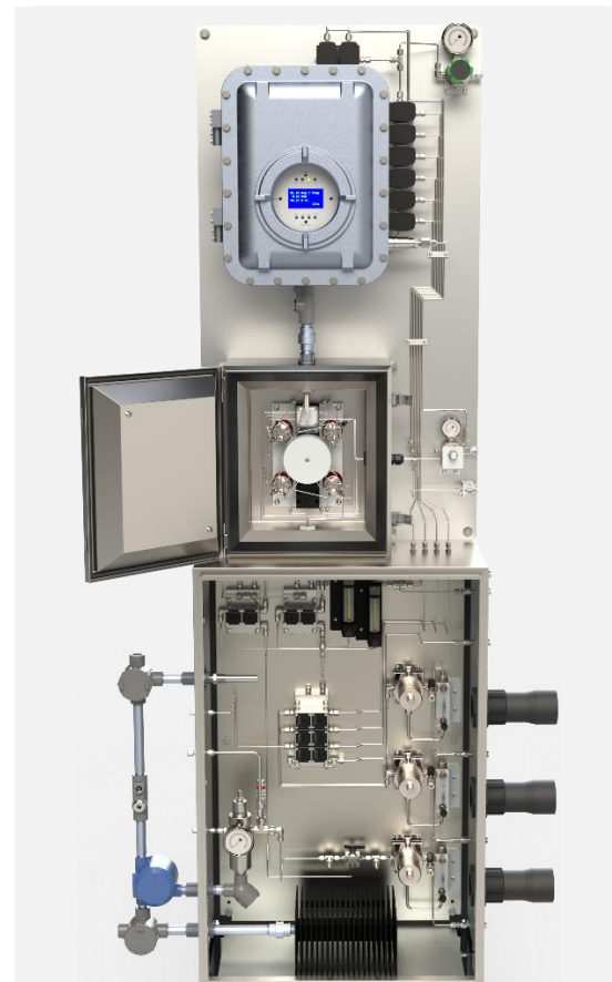
Configuración de CG 131S de Proceso