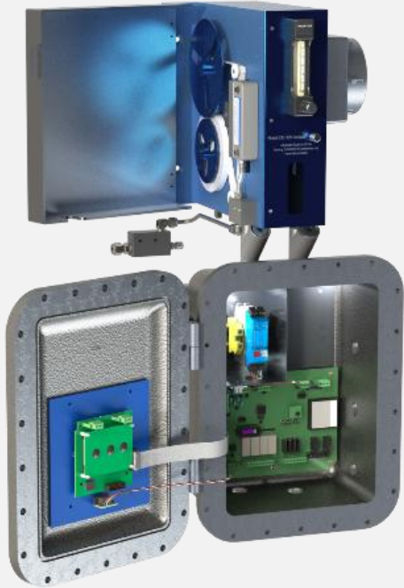
安穩特 330S-EX 型分析仪