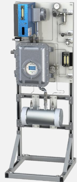
安稳特 330S-EX 型