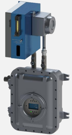
安稳特 330S-EX 型 H 2 S 分析仪