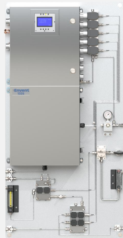
132S 型，BTU 热值配置