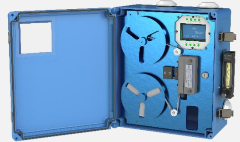
安稳特 331S型 H 2 S分析仪