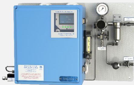
使用标准样品调节装置的 331S 型号硫化氢分析仪