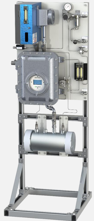
安稳特 330S型 配标准样品处理系统和总硫反应炉