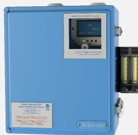
安稳特 331SDS 型 H 2 S 分析仪