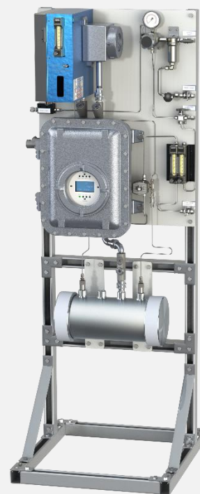
安稳特 330SDS 型