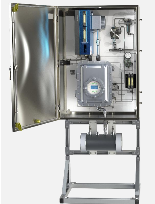
331SDS 型 H 2 S 和总硫分析仪 不锈钢壳梯 带自动校准功能