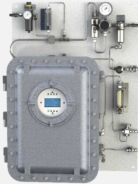
TFS1 型，配置用于饱和气体和脏污气体的样品处理系统