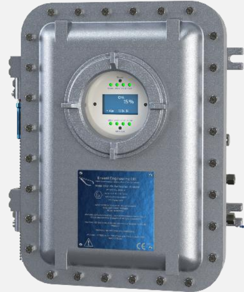
安稳特 TFS1 型产品