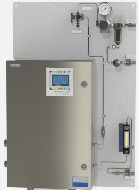
TFS2 型产品，配标准样品处理系统