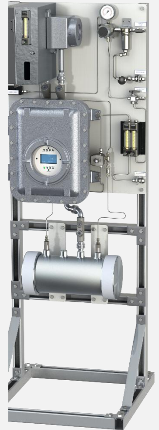
安稳特 330S型 配标准样品处理系统和总硫反应炉